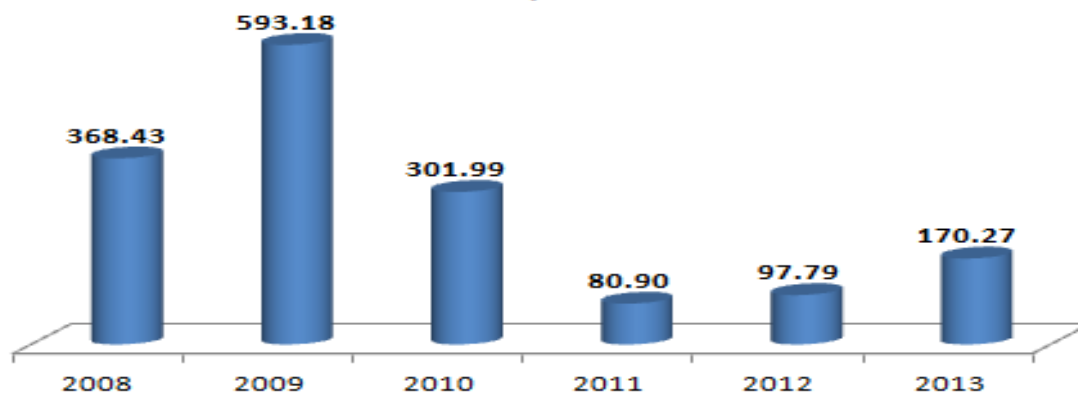
Sinaloa: Inversión turística privada , en millones de dólares, c/año