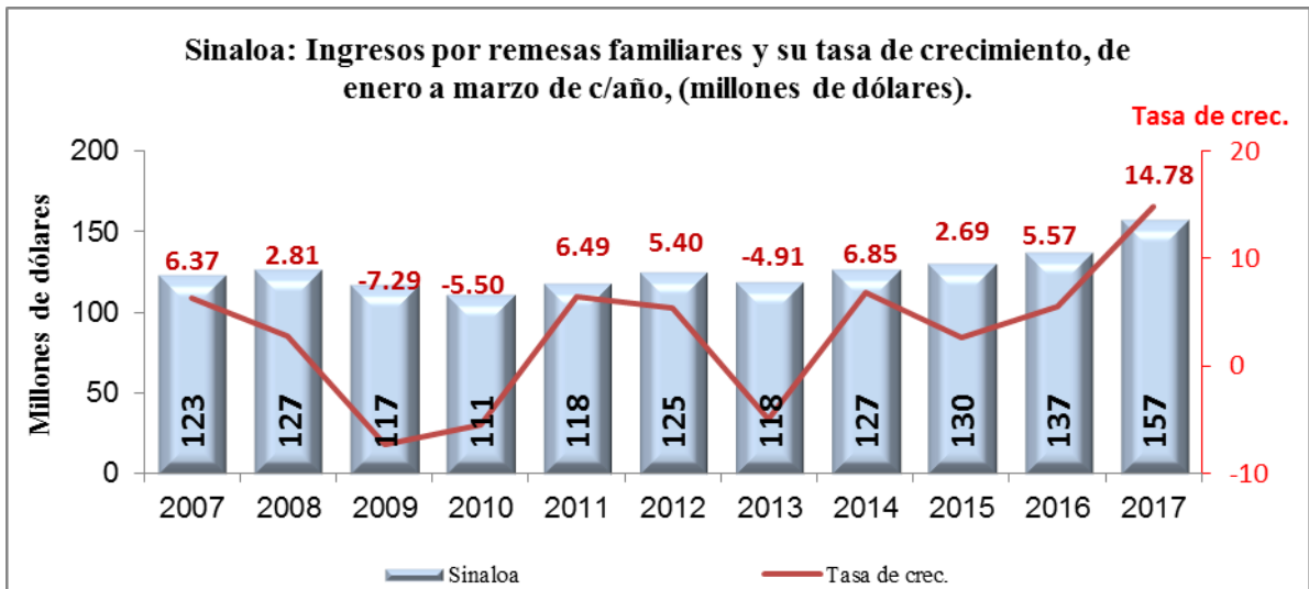
Gráfica No. 1