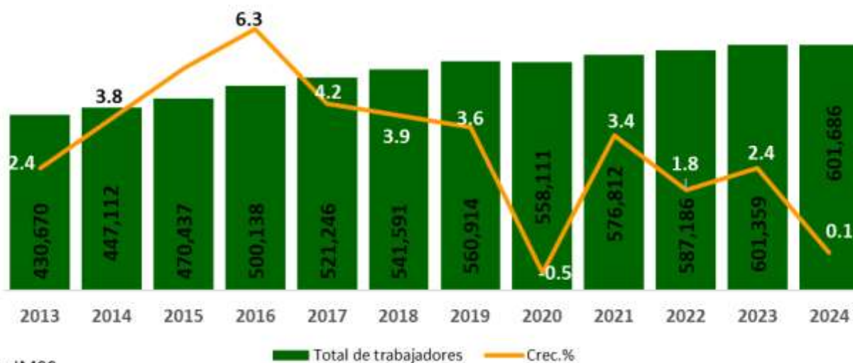
Número promedio mensual de puestos de trabajo formales registrados en Sinaloa en cada año

En Sinaloa, la baja generación del empleo formal, se vincula con la reducción en el sector primario y también por la caída de fuentes de trabajo en la industria de la construcción.