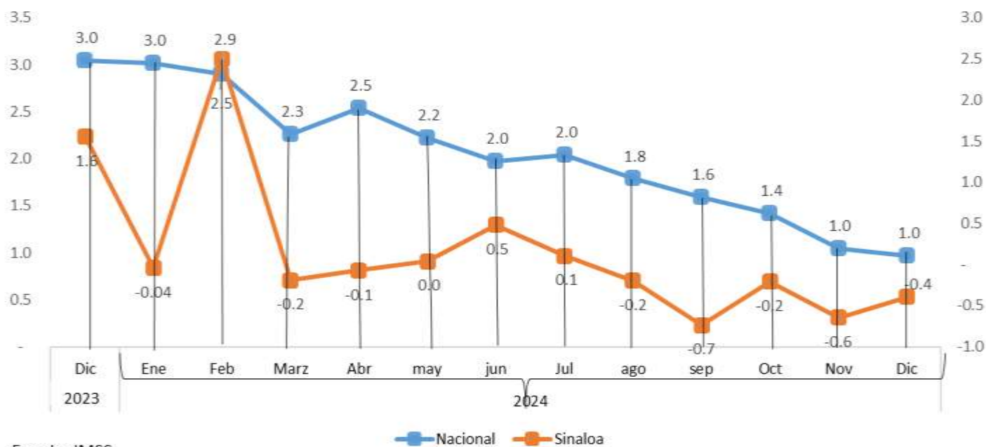
Empleo formal registrados en el IMSS Tasa de crecimiento analizada mensual

A lo largo de los últimos 12 meses se puede observar que el ritmo de crecimiento del empleo a nivel nacional es superior al de Sinaloa. Mientras a nivel nacional la tasa de crecimiento es permanentemente positivo; en Sinaloa, se registran tasas negativas en 8 meses.